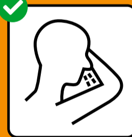
Tousser et éternuer dans un mouchoir ou dans le creux du coude.