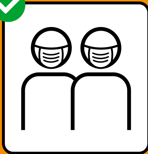
Porter un masque si on ne peut pas garder ses distances.