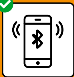
Interrompre les chaînes de transmission avec l'application SwissCovid.