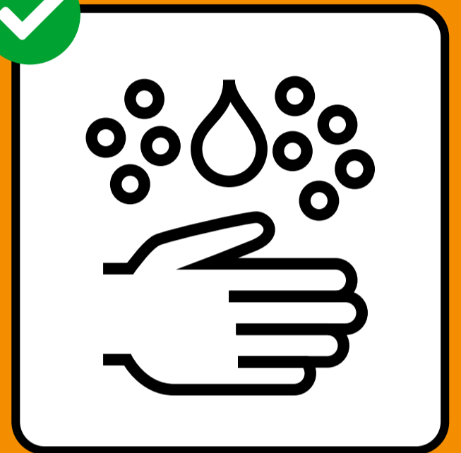
Se laver soigneusement les mains.