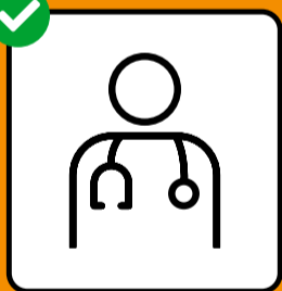
En cas de symptômes, se faire tester immédiatement et rester à la maison.