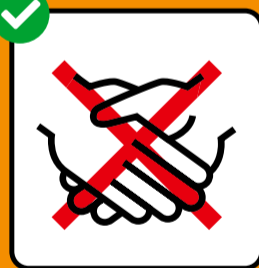
Ne pas se serrer la main.