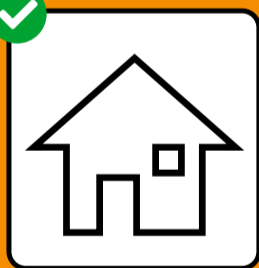
Test positif : isolement. Contact avec une personne testée positive : quarantaine.