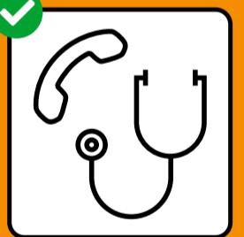
Se rendre chez le médecin ou aux urgences seulement après avoir téléphoné.